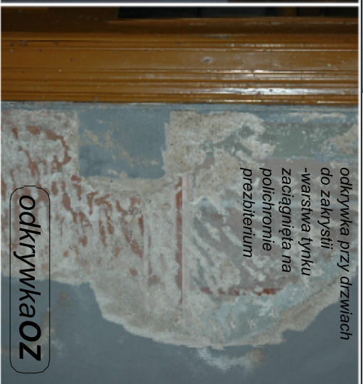
odkrywka przy drzwiach do zakrystii -warstwa tynku zaciągnięta na polichromie prezbitorium