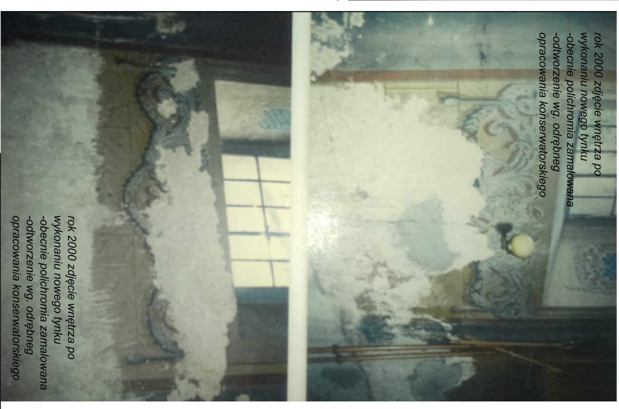
rok 2000 zdjęcie wnętrza po wykonaniu nowego tynku -obecnie polichromia zamalowana -odtworzenie wg. odrębneg opracowania konserwatorskiego