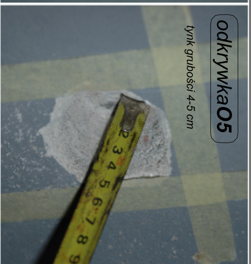
odkrywka05 tynk grubości 4-5 cm