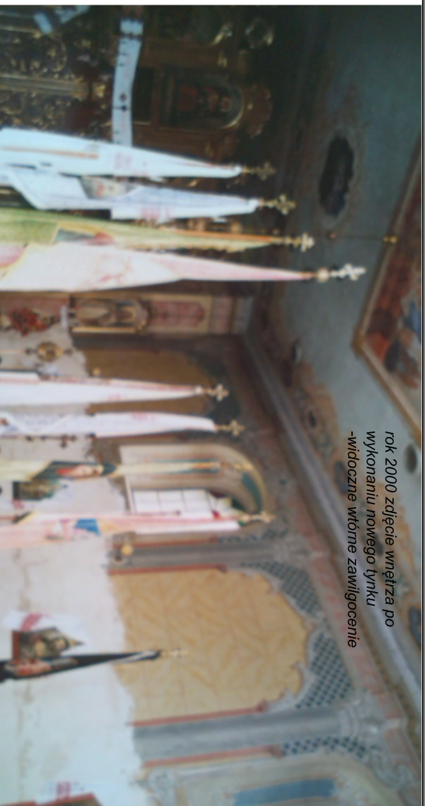
rok 2000 zdjęcie wnętrza po wykonaniu nowego tynku -widoczne wótime zawilgocenie